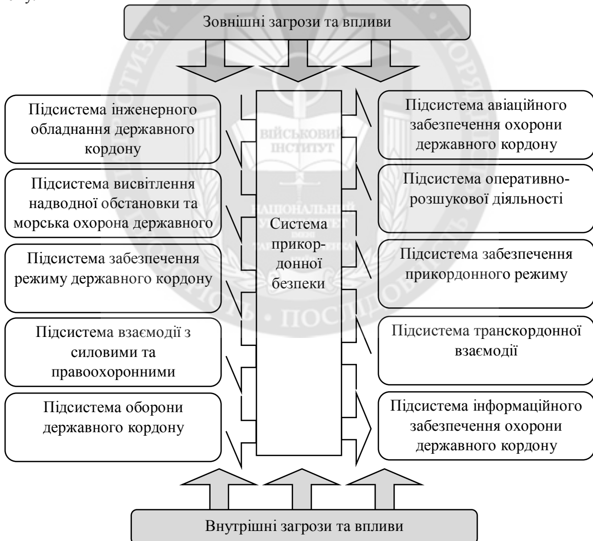
Рис. 1. Система прикордонної безпеки

Вивчення таких систем в природних умовах обмежене їх складністю, а іноді буває неможливим з огляду на те, що не можна провести натурний експеримент, відтворити ті чи інші ознаки, властивості та впливи складної системи. У цих умовах єдиним можливим методом дослідження є моделювання (фізичне, логічне, математичне). В процесі моделювання враховується як реакція складної системи так і зовнішні та керівні впливи на систему.