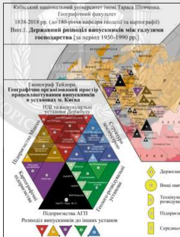
Рисунок 4 – Побудова характеризуючих елементів синтезованої фігури «Еконограф Тейлора» (фрагмент карти)