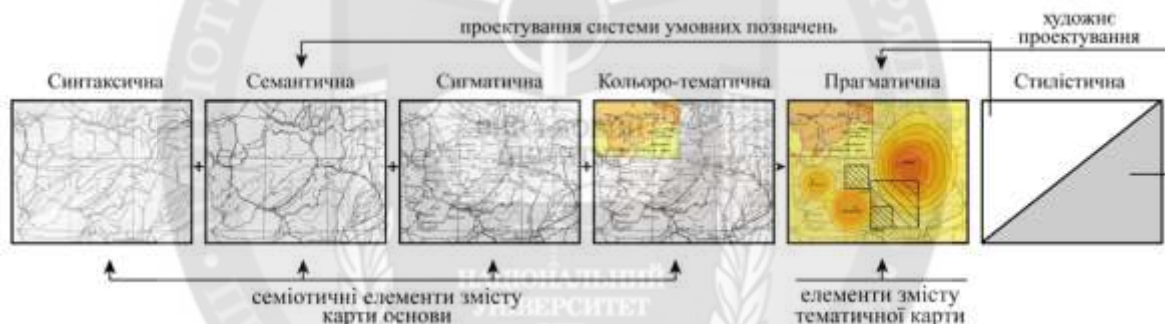
Рисунок 2 – Семіотичні складові елементи змісту унормованої структури об'єктної мови карти

Мета. Розробка карти-основи та семіотичних складових окремих елементів змісту інтерактивного атласу ВНЗ освітньо-управлінського типу ставиться як завдання забезпечення об'єктно - орієнтованого картографічного моделювання системи вищої освіти в Україні на локальному рівні надання освітніх послуг, на прикладі діяльності класичного навчального закладу – Київського національного університету імені Тараса Шевченка.