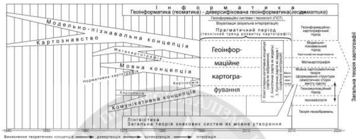
Рисунок 1 – Етапи розвитку теоретичного процесу в картографії

Виділено етапи розвитку теоретичного процесу в картографії: а) – різноконцептуально-го розвитку в період (1940-1990 рр.) розквіту повоєнного «теоретичного п'ятидесятиріччя». б) – прагматичний період (1990-2010 рр.) становлення технічного тренду розвитку. в) – формування міжнародного теоретичного тренду (2000-2010 рр.) трьох провідних концепцій картографії. г) – концептуальне середовище сучасного тренду (до 2020 р.) сформованості загальної теорії картографії.