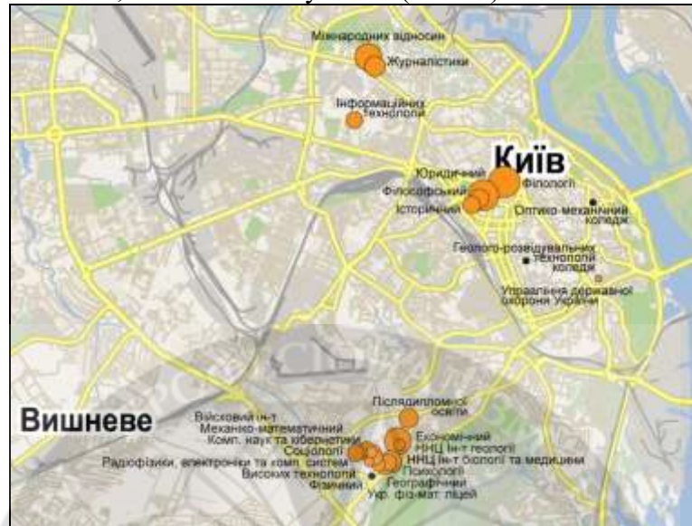
Рисунок 3 – Відображення територіальної організації структурних підрозділів університету, за допомогою аналітичного показника кількості студентів та курсантів

університету, хоч він більш-менш стабільний. Він склав величину (-29.67). Отже, прогнозна розрахункова чисельність НПП ( 108.78 - 29.67 + 0,68\text{ДЕК} = 79,8 ), яка у порівнянні з розрахунковою чисельністю НПП ( 101.97 - 79.8 ) становить величину НПП (22.2), що підлягає скороченню. Остаточні результати розрахунків відображено на узагальнюючій об'ємній фігурі «знаку Варзара», що наочно відображатиме параметри вказаних величин по кожному із структурних підрозділів університету в залежності від вихідного значення загальної чисельності студентів у порівнянні з найменшим, масштаб змісту якого ( m=128 ).