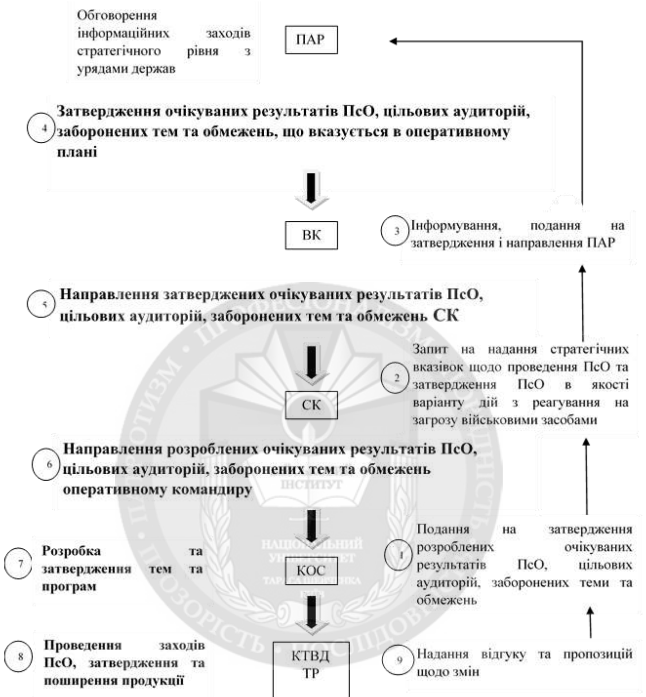
Рисунок 1 - Організація ПсО в НАТО [9, с. 2-4]:

ПАР – Північноатлантична рада; ВК – Військовий комітет; СК – Стратегічне командування; Кос – командувач об’єднаних сил; КТВД ТР – командир на театрі воєнних дій тактичного рівня