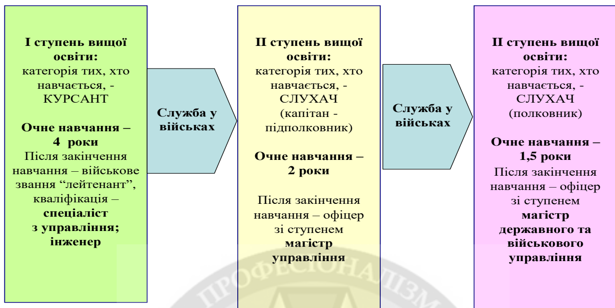
Рисунок 2 – Підготовка офіцерських кадрів командного фаху

Шість факультетів академії (загальновійськовий; зв'язку та автоматизованих систем управління; протиповітряної оборони; військової розвідки; авіаційний; внутрішніх військ) практично повністю забезпечують потребу збройних сил в офіцерських кадрах. Загальний набір на навчання у 2019 році склав 501 особу ( в тому числі для збройних сил - 412 осіб; державного прикордонного комітету – 22 особи; внутрішніх військ міністерства внутрішніх справ – 63 особи, міністерства з надзвичайних ситуацій – 4 особи) [17].