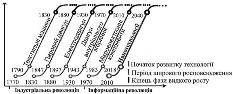
Рисунок 1 – Зміна технологічних укладів і поколінь техніки

Результати, до яких можуть призвести розвиток і поширення нанотехнологій, видаються вельми радикальними за своїми наслідками і глобальними за масштабами. Причому це стосується не тільки і навіть не стільки (в силу спірності наявних прогнозів) віддалених ефектів, але насамперед найближчих, вже початківців проявлятися наслідків для зміни науково-технологічних потенціалів країн і їх глобальної конкурентоспроможності. Нанотехнологічна революція це реальність (рис. 2).