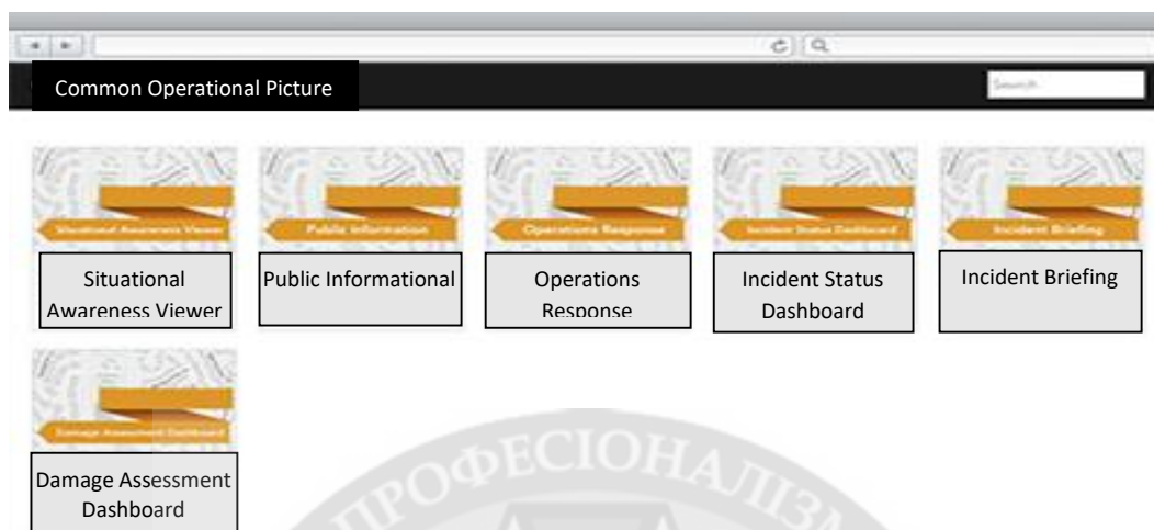
Рисунок 3 – Сервіси ситуаційної обізнаності на ArcGIS Online

На рис. 3 представлений приклад робочого екрану сервісів, які можуть бути організовані набором сфокусованих карт та додатків. Цей вміст подано в рішенні ситуаційної обізнаності у загальну операційну картину, яке покращує обмін інформацією та забезпечує єдине місце для виявлення інформації про інцидент чи подію.