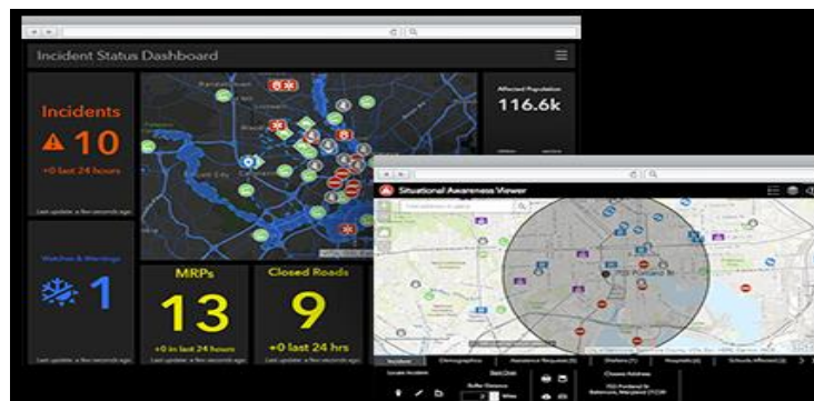
Рисунок 2 – Інформаційні панелі рішення про ситуаційну обізнаність на основі ArcGIS

Поінформованість про ситуацію та використання цієї інформації реалізовані за рахунок набору додатків, орієнтованих на місію, що доставляються через загальну операційну картину, рис. 2.